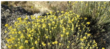
Le Maquis Corse

Et si vous fermez les yeux, vous êtes envahis par des senteurs multi parfums envoûtantes. Enfin, au-delà des fleurs, cette nature à l'état pur a l'art de vous réserver des surprises. Par exemple : certains blocs de granit présentent des formes anthropomorphiques telles un oiseau, un éléphant ou le gorille ici en photo.