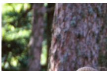
Suivez le guide