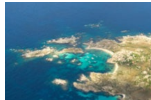
Balade de plage en plage