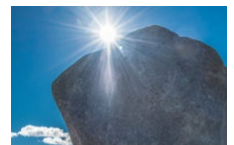
Balade à la montagne