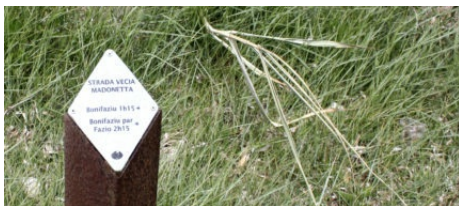
Sentier de Strada Vecia

Bien souvent, c'est plusieurs plages ou des criques qui s'offrent à vous : sentier de Strada Vecia deux plages et le record appartient sûrement au sentier de l'île Lavezzu qui mène à pas moins de 9 plages de sable fin, sans même compter les criques.