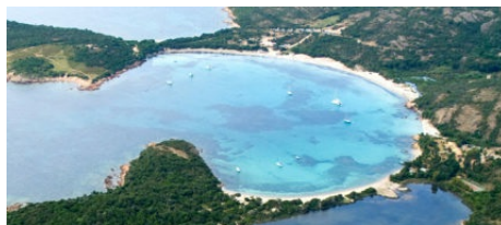
Sentier de Rundinara