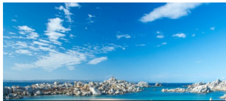
Sentier de l'île Lavezzu