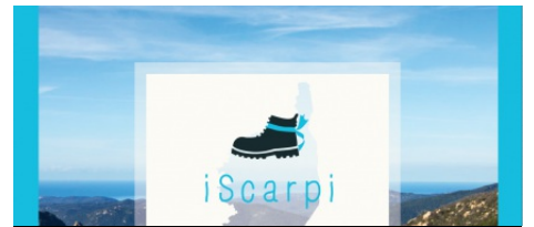
Appli « i Scarpi » : à vos chaussures de marche !