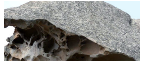
Sentier de Monacia d'Aullène