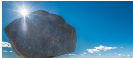
Sentier de l'Uomo Di Cagna