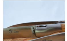
Les Terrasses d'Aragon en Haute-Ville