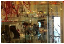
La Boutique du Corailleur