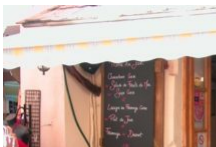
Restaurant Cantina Doria