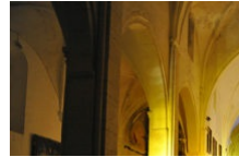
Les Jeudis Polyphoniques