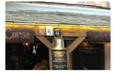
Restaurant l'Auberge Corse