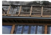
Restaurant Kissing Pigs