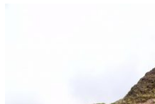
Sentiers à 1h de Bonifacio