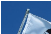
Tout sur la Corse