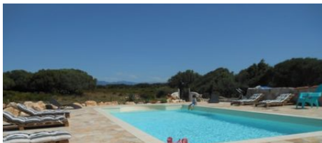
Résidence A Suliata

Les oliviers sauvages, les chênes verts et les arbousiers vous apportent un camaïeu de vert très reposant. Tous vos sens seront mis en éveil grâce aux chants des oiseaux et aux senteurs et tout est fait pour que vos vacances soient des plus agréables.