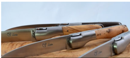
Les Terrasses d'Aragon en Haute-Ville