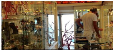
La Boutique du Corailleur