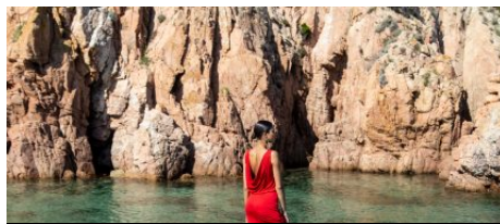
Boutique Karma Koma