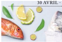
Art'è gustu – Festival culinaire