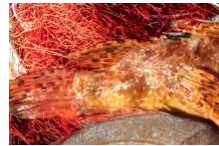
La pêche locale