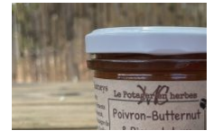
Le potager en herbes