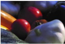
Le maraîchage et ses produits dérivés