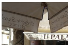
Glacier U Palazzu