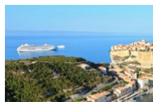
Promenade sur la Marina de Bonifacio