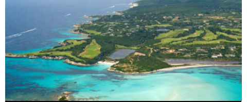
Le Top 10 des plages en Corse