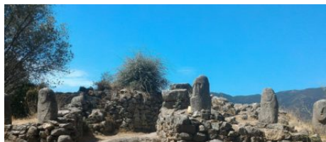
Filitosa, le site préhistorique en Corse