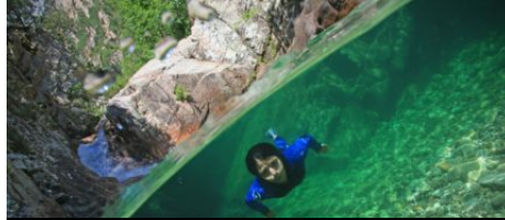
Le canyoning en Corse