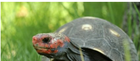
A Cupulatta, le parc des tortues en Corse