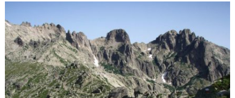
Le GR20 en Corse