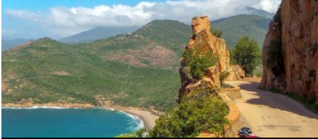
GT-20 : la « Grande Traversée » de la Corse à vélo