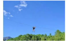
Sur un fil ...