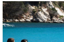
Petit trot et grand galop