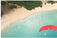
S'envoyer en l'air !

Profitez de vos vacances pour découvrir Bonifacio et le Sud Corse autrement que ce soit en famille avec des tous petits ou des ados, en couple ou en groupe. Il y a de nombreuses activités : du golf , des sorties en quad, des balades à cheval ou en VTT électrique, du canyoning en montagne, du saut en parachute , des balades en hélicoptère...tout est possible, il vous suffit de choisir les sensations que vous voulez vivre !