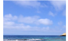
Balade vers le phare de Pertusatu