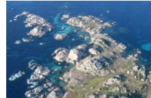
Une escapade sur les îles Lavezzi